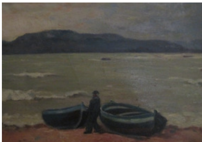
Rodolfo Cristina, MARINA, olio su tela, cm. 50 x 70