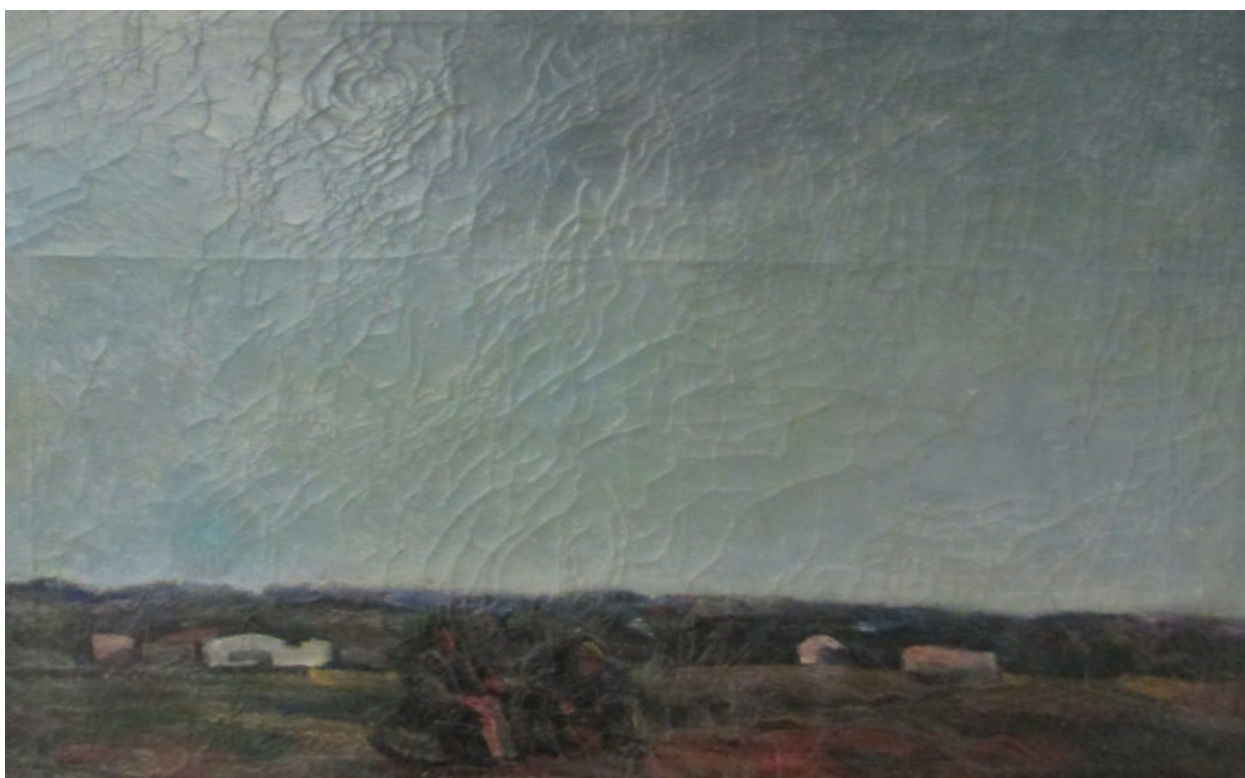
Rodolfo Cristina, MERIGGIO, olio su tela, cm. 80 x 100

Sicuramente a questa particolare predisposizione appartiene Rodolfo Cristina , pittore ed uomo, a tutto tondo, che nella sua, purtroppo breve attività, ha sempre disciplinato la sua creatività